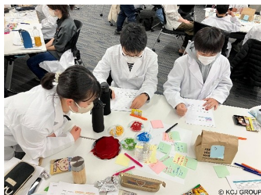
2025 年 3 月実施の様子①

本ワークショップは、「惑星や銀河はどうやってできたのか？」「私たちのような生命は宇宙に存在するのか？」など、壮大な宇宙への疑問と向き合います。科学探究とアート表現を融合させた 3 日間のプログラムを通じて、参加者は探究心を深め、その学びを想像的に発信する力を育むことを目的としています。