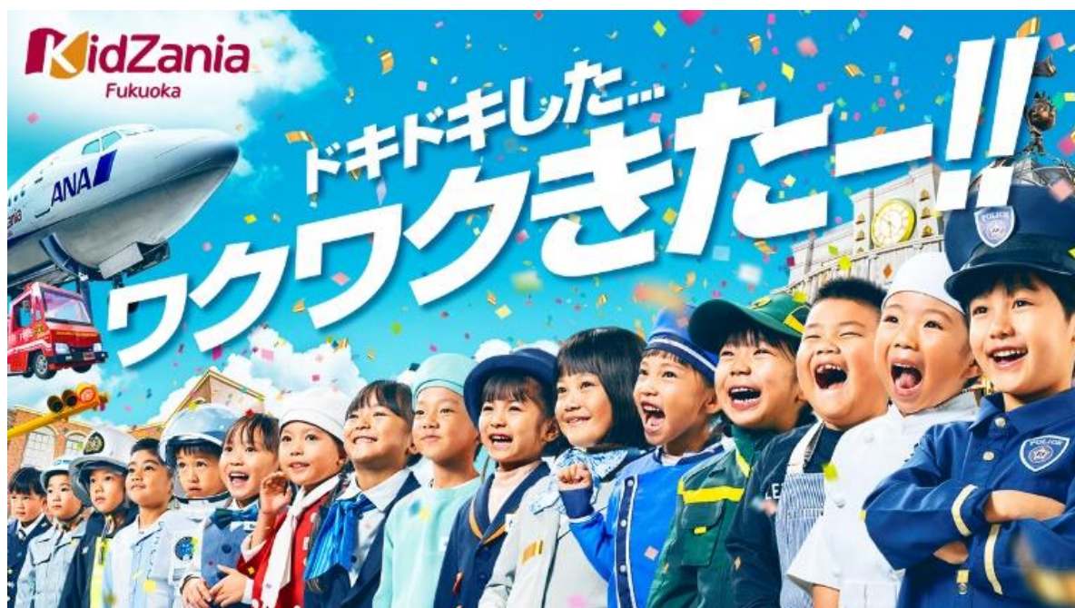
「ドキドキした...ワクワクきたー!!」キービジュアル

2022年7月に国内3拠点目として「キッズニア福岡」を開業し、こども達の夢を見つける応援をしてまいりました。今夏のテレビCM「#未来のたね」では、キッズニアでの体験でキラキラした表情や真剣なまなざしのこども達で「できたね、やったね」というメッセージを表現しました。本作では、キッズニア福岡をさらに盛り上げるべく、“こどもが主役の街”というキッズニアのコンセプトをベースに新メッセージ「ドキドキした...ワクワクきたー!!」へと進化させ、キッズニアならではのドキドキ・ワクワクな体験の場を提供したい思いで制作しました。