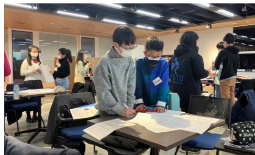
ワークショップ風景（イメージ）