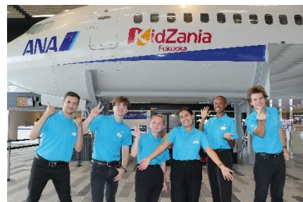
外国人スタッフ(イメージ)