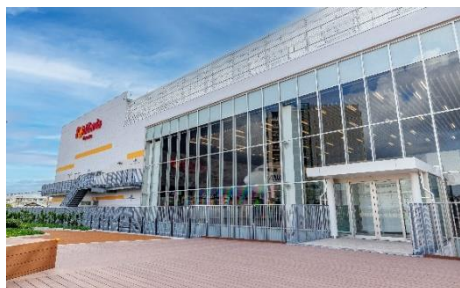
キッズニア福岡(外観)