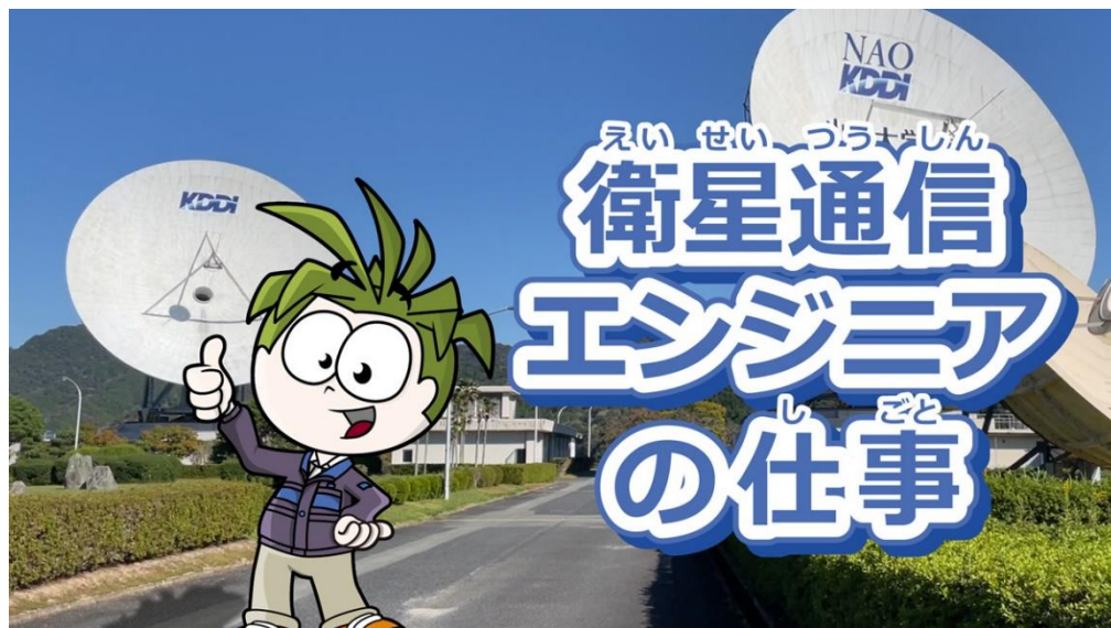
<「衛星通信エンジニア」のコンテンツイメージ>

なお、本コンテンツの内容は、今後順次追加予定です（注）。追加コンテンツとして、2023年2月9日以降はシミュレーターを使って仕事に必要なスキルを学ぶことができる「トレーニング」をお楽しみいただけるようになります。また、2023年3月12日に、現場で働く衛星通信のプロフェッショナルに直接質問ができる「ワークショップ」を開催予定です。