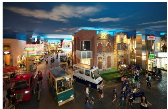
キッズニア東京

本パビリオンでこども達は、ジュエリーデザイナーとして、カルティエの伝統的なデザインをもとに作品を完成させます。ブティックで実際に採用しているインテリアをとり入れた明るい空間が広がるパビリオンで、こども達は、アクティビティを通して、カルティエの歴史や伝統についての知識を深め、普遍の美を追求するカルティエのモノづくりを学びます。