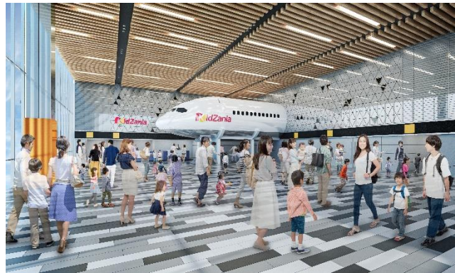
入口付近（イメージ）