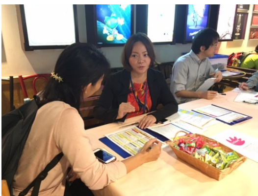
<適職診断 体験者の方のお写真とコメント>

「やはり人や子供と接点のある仕事がしたい」(30代、求職予定) 「現在の仕事とあっているの、納得感がある」(40代、就業中)