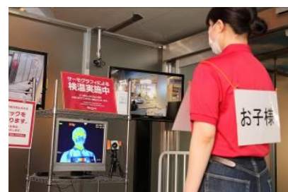
サーモグラフィでの検知により、37.5度以上のお客様の入場をお断りします