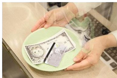
キッズや現金のやり取りは、直接触れないようトレーを使用します