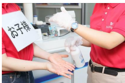
館内への入場前、およびアクティビティ体験前に手指の消毒を徹底します