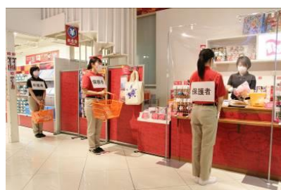
グループ毎の待機列は1.5mの間隔をあけます