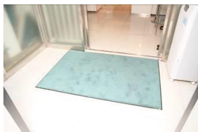
靴底抗菌マットの上をってから入場します