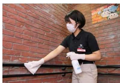
手が触れる場所や箇所の噴霧・清拭作業を、随時実施いたします