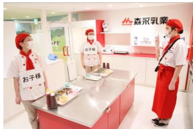
パビリオンの各回の定員を制限し、密接を防ぎます

◆営業再開に伴う主な取り組みの例(イメージ)◆ ※従業員を子どもと保護者に見立てて撮影(2020年5月末)