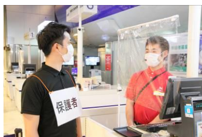
お客様と対面になる場所は飛沫を防ぐカーテンを設置します