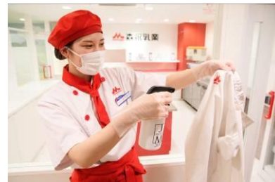
ユニフォームは子どもが着用することに消毒します