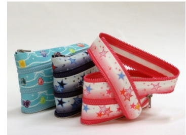
【ファスナーポーチ (イメージ)】