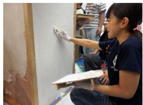
【左官職人(イメージ)】