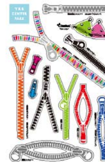
【ファスナーステッカー】

キッズニア東京内に設置されたファスナーに関する問題パネルを探し出し、質問に答えます。全問正解の方には「ファスナーステッカー」をプレゼントします。