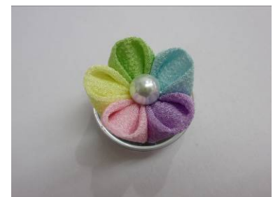
【つまみ細工のマグネット(イメージ)】