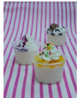
【商品開発シートとオリジナル商品の完成イメージ】

また、森永乳業とKCJ GROUPは今後の展開として、キッズニアを飛び出し「実社会の仕事」を体験できるプログラム『Out of KidZania』の開催も検討しています。このプログラムでは、こども達が食生活を支える「いきもの」に触れ、命をいただいていることに気づく機会を提供するとともに、おいしく、安全・安心な商品がどのように作られ、食卓へ届くのかを学ぶことができる体験を提供する予定です。