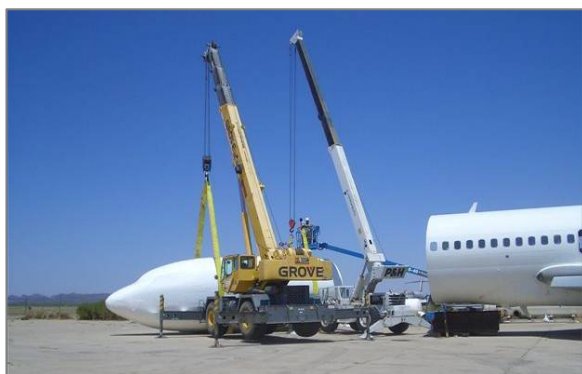
2008年6月17日 アリゾナから運ばれる飛行機の機体